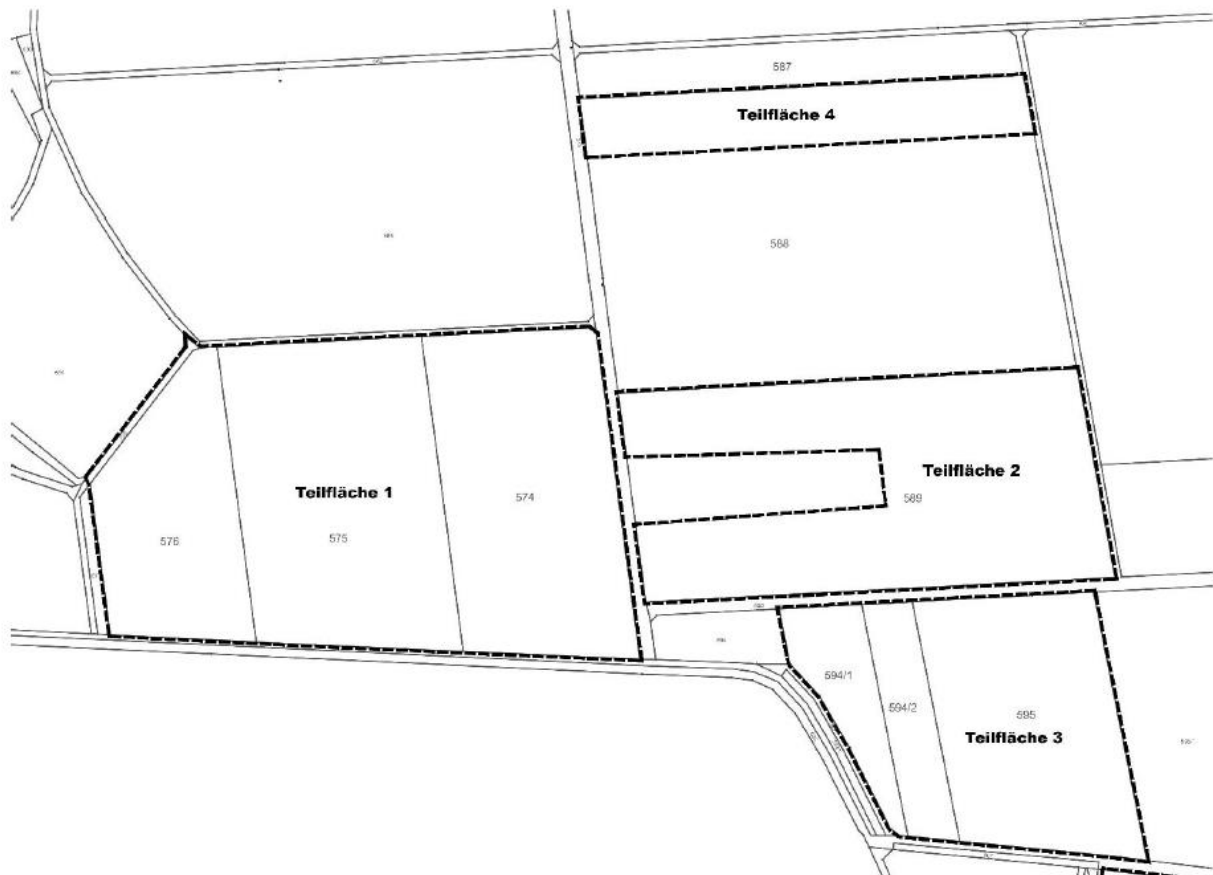
Detaillageplan Gnodstadt Mitte

Der Geltungsbereich Gnodstadt Mitte umfasst die Flur-Nrn. 574, 575, 576, 594/1, 594/2, 595 und Teile der Flur-Nrn. 578 (Wirtschaftsweg), 588 und 589 der Gemarkung Gnodstadt mit einer Fläche von 12,9 ha (s. nachfolgenden Detaillageplan).