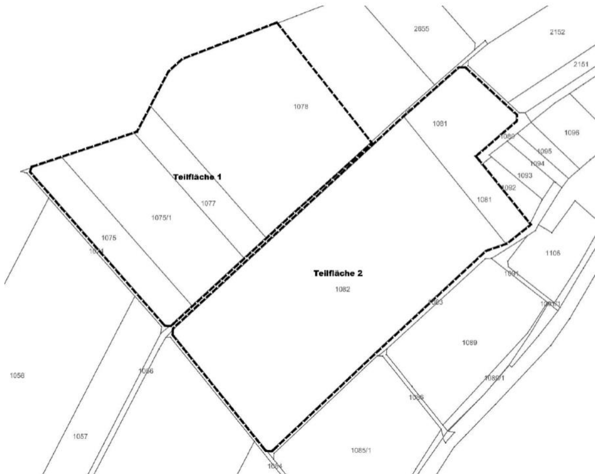
Detaillageplan Gnodstadt Ost