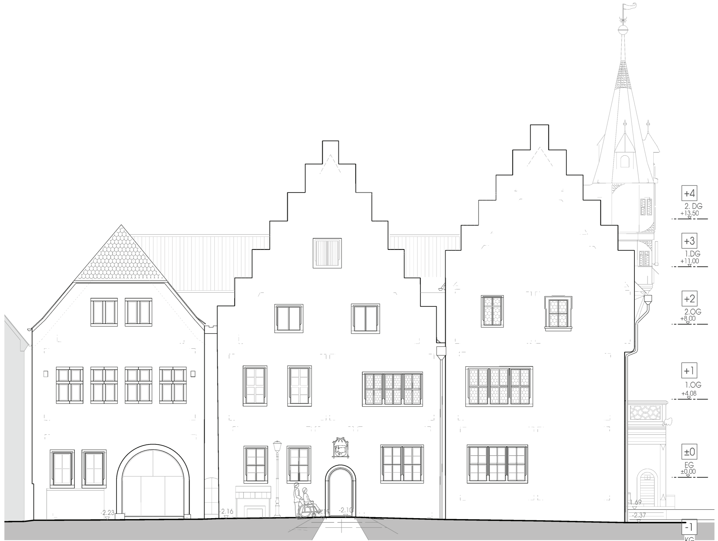
VORENTWURF HAUS I-III - Ansicht Ost