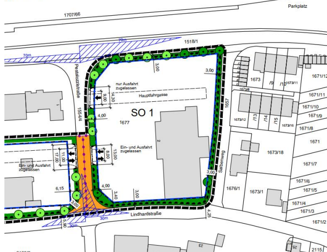
Lageplan - ohne Maßstab